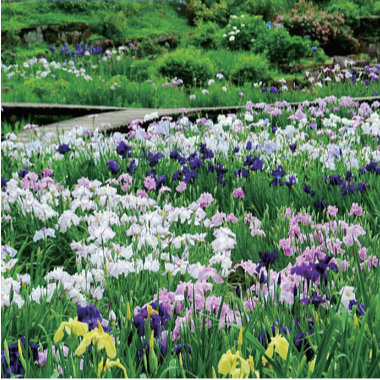
花の郷 滝谷花しょうぶ園

約1万坪の敷地に花しょうぶのほか、てっせん(クレマチス)やあじさいなど多種多様な花があでやかに咲く。喫茶や食堂、バーベキュー場など施設が充実しており、苗や鉢植えの販売も。花にちなんだオリジナル商品も多数取り揃える。