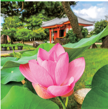
きこうじ 法相宗別格本山 喜光寺

世界最古のハス「大賀蓮」や「中尊寺蓮」、北米生まれで鮮やかな黄色が特徴の「ヴァージニア蓮」など約80種、250鉢が鑑賞できる。ハスは午後には閉じてしまうので、早朝の参拝がおすすめ。