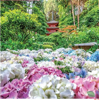
がんせんじ 岩船寺

あじさいの名所として親しまれる「花の寺」。重要文化財の三重塔を背景に咲くあじさいは絶好のフォトスポット。原種の山あじさい、西洋あじさいなど、35種5000株の花が人々の心をなごませてくれる。