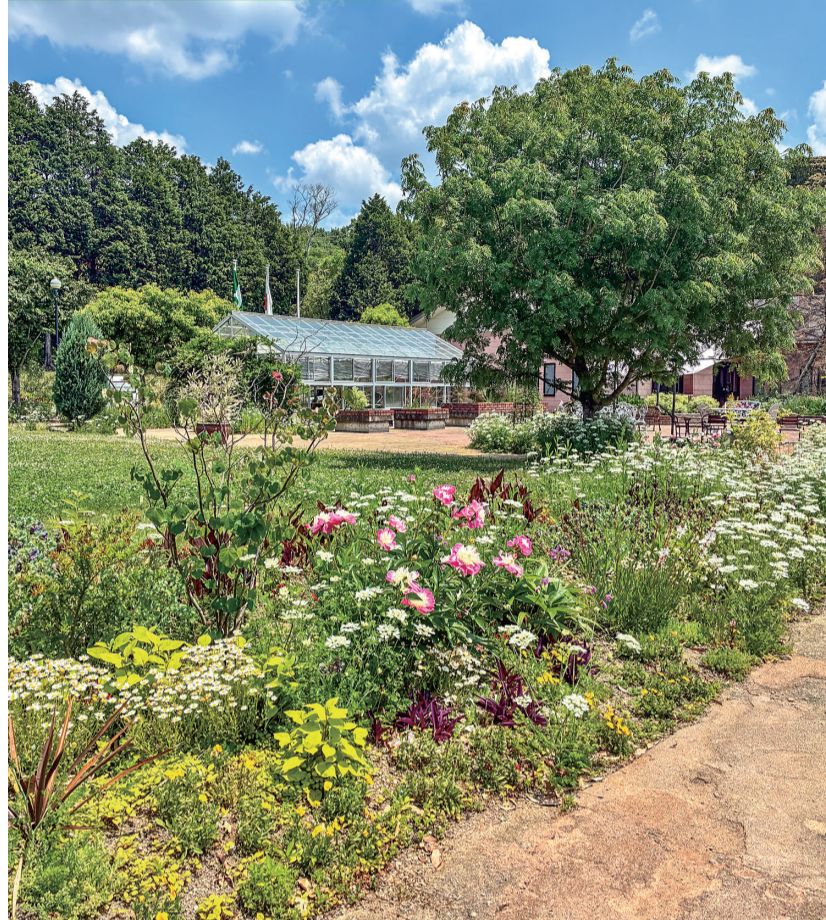
生駒市花のまちづくりセンター ふろーらむ

花や緑を通じて地域のコミュニティを育む施設。庭に足を踏み入れると、色とりどりの季節の花が咲き誇り、まるでイングリッシュガーデンのような世界が広がる。フラワーアレンジメントなど各種ガーデニング講座が開催されているほか、カフェも併設。